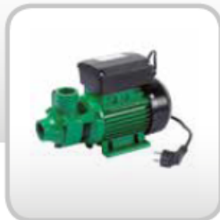
Kuro užpildymo įranga