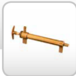
Pompa alyvos išsiurbimui