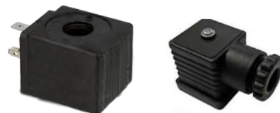
connettore incluso con la bobina connector included with the coil

A = 230 V a.c. bobina fino a 1" e connettore-coil up to 1"+conn. B = 24 V a.c. bobina fino a 1" e connettore-coil up to 1"+conn. C = 230 V a.c. bobina maggiore di 1" e connettore-coil over 1"+conn. D = 24 V a.c. bobina maggiore di 1" e connettore-coil over 1"+conn. E = 24 V d.c. bobina fino a 1" e connettore-coil up to 1"+conn. F = 110 V a.c. bobina fino a 1" e connettore-coil up to 1"+conn. G = 24 V d.c. bobina maggiore di 1 e connettore-coil over 1"+conn. H = 110 V a.c. bobina maggiore di 1 e connettore-coil over 1"+conn. I = solo per valvole NA. da 1 1/2" e 2" 230 V a.c. - only for N.O. from 1 1/2 and 2" 230V a.c. L = solo per valvole NA. da 1 1/2" e 2" 24 V a.c. - only for N.O. from 1 1/2 and 2" 230V a.c.