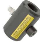
Oro inžektorius (papildomai)