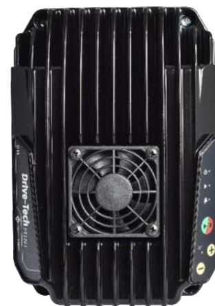
Pavaros technologija MINI

Siekiant užtikrinti geriausią apsaugą, rekomenduojama naudoti 4polių filtrus, kurie veikia esant linija-žemė įtampos pikams.