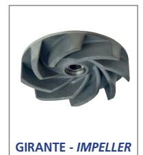
GIRANTE - IMPELLER