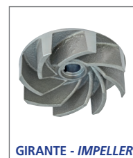
GIRANTE - IMPELLER